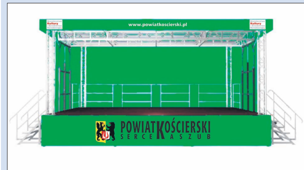
Estrada mobilna to profesjonalne zadanie przystosowane do występów scenicznych. Przeznaczona będzie do prowadzenia różnego rodzaju imprez widowiskowych i kulturalnych na terenie Powiatu Kościerskiego

Powiat Kościerski pozyskał dotację z Ministerstwa Kultury i Dziedzictwa Narodowego w wysokości 70 tys. zł na wzmocnienie infrastruktury kulturalnej w Powiecie. Dzięki dotacji oraz środkom z budżetu Powiatu zostanie zakupiona profesjonalna estrada mobilna wraz z nagłośnieniem i oświetleniem sceny. Koszt całkowity estrady o wymiarach 7,5m x 6m wyniesie ponad 130 tys. zł. Służyć ona będzie mieszkańcom Naszego Powiatu podczas różnego rodzaju imprez widowiskowych i kulturalnych, a w szczególności podczas Dni Powiatu, które w tym roku organizowane będą w każdej z gmin Powiatu Kościerskiego.