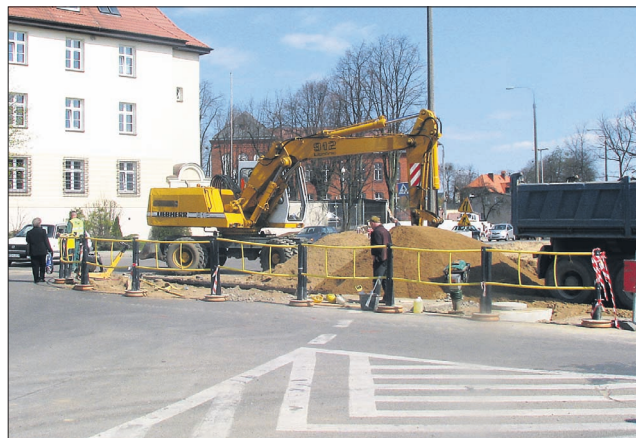
Prace przy modernizacji ciągu ulic Skłodowskiej-Curie, Zgromadzenia Księży Zmartwychwstańców oraz Wybickiego w Kościerzynie idą zgodnie z planem. Powiat Kościerski dofinansował tę miejską inwestycję w wysokości 1 mln zł

M ało mówi się o dotacjach Powiatu do inwestycji gminnych lub inwestycji prowadzonych przez gminy. Warto wspomnieć, że na ostatniej sesji Rada Powiatu Kościerskiego podjęła uchwałę, którą wsparła finansowo projekt Zakładów Energetyki