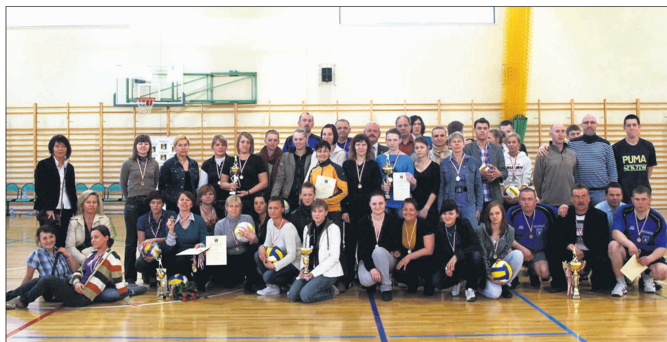
Zawodnicy, uczestnicy oraz organizatorzy Powiatowej Ligi Piłki Siatkowej Kobiet i Mężczyzn w sezonie 2009/2010

W dniu 18 kwietnia br. w Hali Sportowej „Sokolnia” w Kościerzynie odbyły się finały Powiatowej Ligi Piłki Siatkowej Kobiet i Mężczyzn. Był to drugi, wspólny finał tych dwóch Lig, chociaż same rozgrywki mają już wieloletnią tradycję. W obecnym sezonie 2009/2010 w rozgrywkach wzięło udział łącznie 23 drużyny – 12 drużyn kobiecych i 11 męskich. Rozgrywki rozpoczęły się w październiku ubiegłego roku, by w poprzedni weekend spotkać się na Turnieju Finałowym w Hali Sportowej „Sokolnia” w Kościerzynie. Po emocjonujących i stojących na wysokim poziomie meczach, Mistrzem Ligi wśród kobiet została drużyna ze Starej Kiszewy, natomiast wśród mężczyzn najlepszą okazała się drużyna Relaksu Dziemiany. Należy zaznaczyć, że organizatorem Ligi był Ośrodek Kultury w Dziemianach, a rozgrywki odbywały się pod patronatem Starosty Kościerskiego. Podobnie jak w poprzednich edycjach, także w tym roku puchary, medale i nagrody rze-