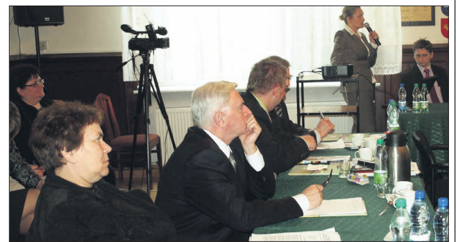
Radni podczas kwietniowej sesji wysłuchali m.in. sprawozdań dot. stery opieki społecznej