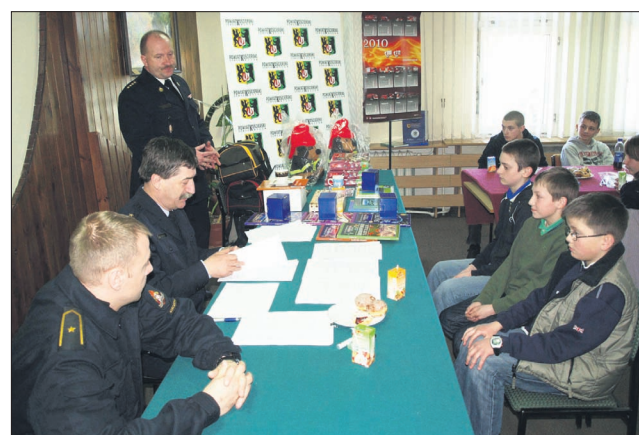
Poziom turnieju stał na wysokim poziomie, dlatego szczególnie należy pogratulować zwycięzcom i życzyć powodzenia na etapie wojewódzkim, w którym będą oni reprezentować Powiat Kościerski