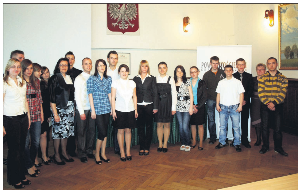
Stypendyści Starosty Kościerskiego w roku 2010

Stypendia przyznane zostały na podstawie uchwały Zarządu Powiatu, która określała szczegółowe warunki uprawniające