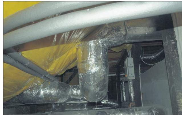
Centrala wentylacji, na którą szkoła pozyskała dotację z Ministerstwa Kultury i Dziedzictwa Narodowego, mieści się w pomieszczeniach na strychu placówki.

przez kondygnację budynku – parter, piętro, poddasze, wykonanie obudów kanałów wentylacyjnych, wykonanie izolacji przeciwszumowej w szachtach wentylacyjnych, obróbka przejść