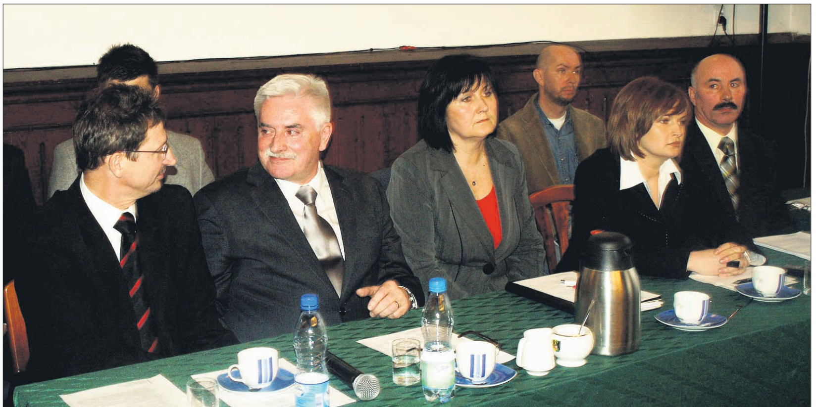
W wyniku decyzji radnych, Starosta wraz z Zarządem Powiatu będą dalej sprawować swoje funkcje.