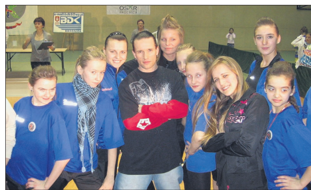
W składzie komisji sędziowskiej podczas turnieju w Brodnicy zasiadał Artur Cieciorński – zwycięzca II edycji YOU CAN DANCE.

Zespół Tańca Nowoczesnego Paradise z Karsina w dniu 7 marca br. uczestniczył w Turnieju Tańca Nowoczesnego, który odbył się w Brodnicy. Turniej rozegrano w kilku kategoriach tanecznych jak i wiekowych, m.in. disco dance, disco show, hip hop, inne formy tańca. W składzie komisji sędziowskiej zasiadał Artur Cieciorński – zwycięzca II edycji YOU CAN DANCE. Dla przypomnienia, jest to popularny program taneczny emitowany na antenie telewizji TVN, przez wszystkich bardzo znany i lubiany. Tancerze zespołu Paradise odebrali z rąk Artura Cieciorńskiego główną nagrodę turnieju