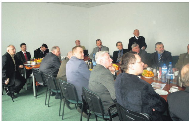
W naradzie podsumowującej rok 2008 w zakresie bezpieczeństwa przeciwpożarowego udział wzięli m.in. samorządowcy, wójtowie, przedstawiciele instytucji i służb z terenu naszego Powiatu.

pożarów, natomiast wzrasta liczba miejscowych zagrożeń. Na terenie Powiatu Kościerskiego w roku 2008 zarejestrowano 981 zdarzeń, z czego każde z nich występowało średnio co 8 godzin 55 minut i 47 sekund. Straż Pożarna interweniowała w 979 przypadkach, w tym w 164 pożarach (16,72% ogólnej ilości zdarzeń), 788 miejscowych zagrożeniach (80,32%) oraz 29 alarmach fałszywych (2,96%). Należy zaznaczyć, że narada odbywała się w bazie Powiatowego Centrum Zarządzania Kryzysowego. Komendant Jerzy Rożek podziękował komendantowi wojewódzkiemu oraz staroście kościerskiemu za decyzję o rozpoczęciu